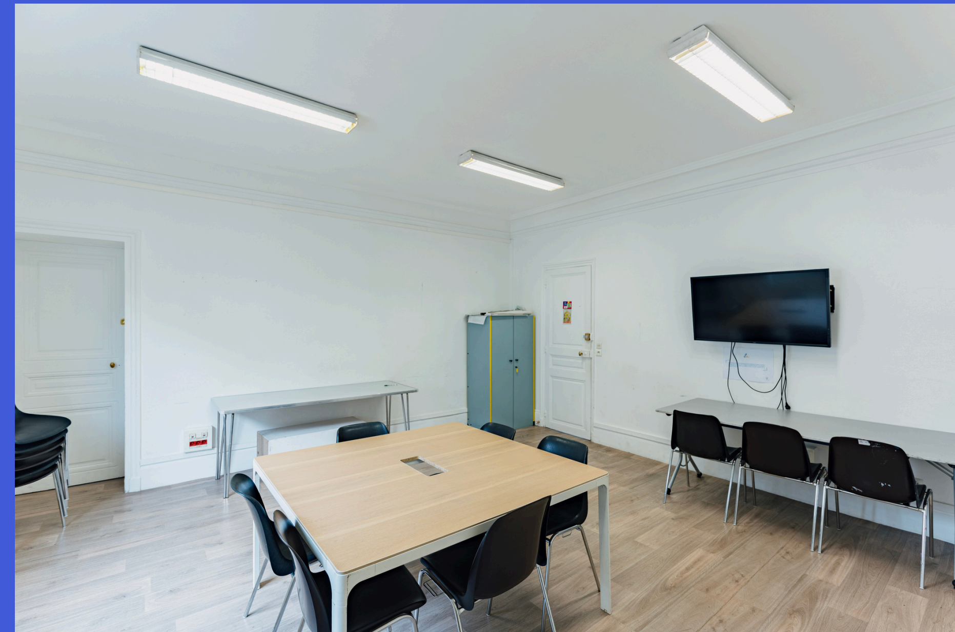
Académie du Climat - Plan du R+3 EXISTANT