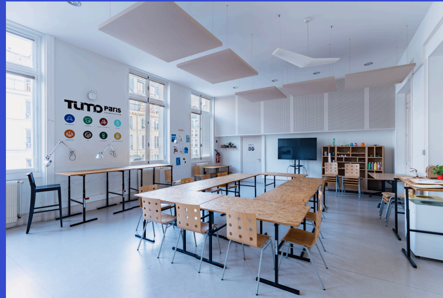
Académie du Climat - Plan du R+2 EXISTANT